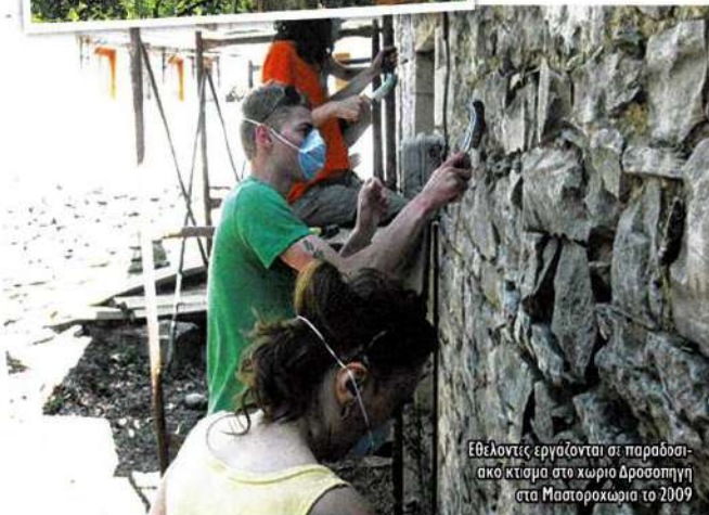
Εθελοντές εργάζονται σε παραδοσιακό κτίσμα στο χωριό Δροσοπηγή στα Μαστοροχώρια το 2009